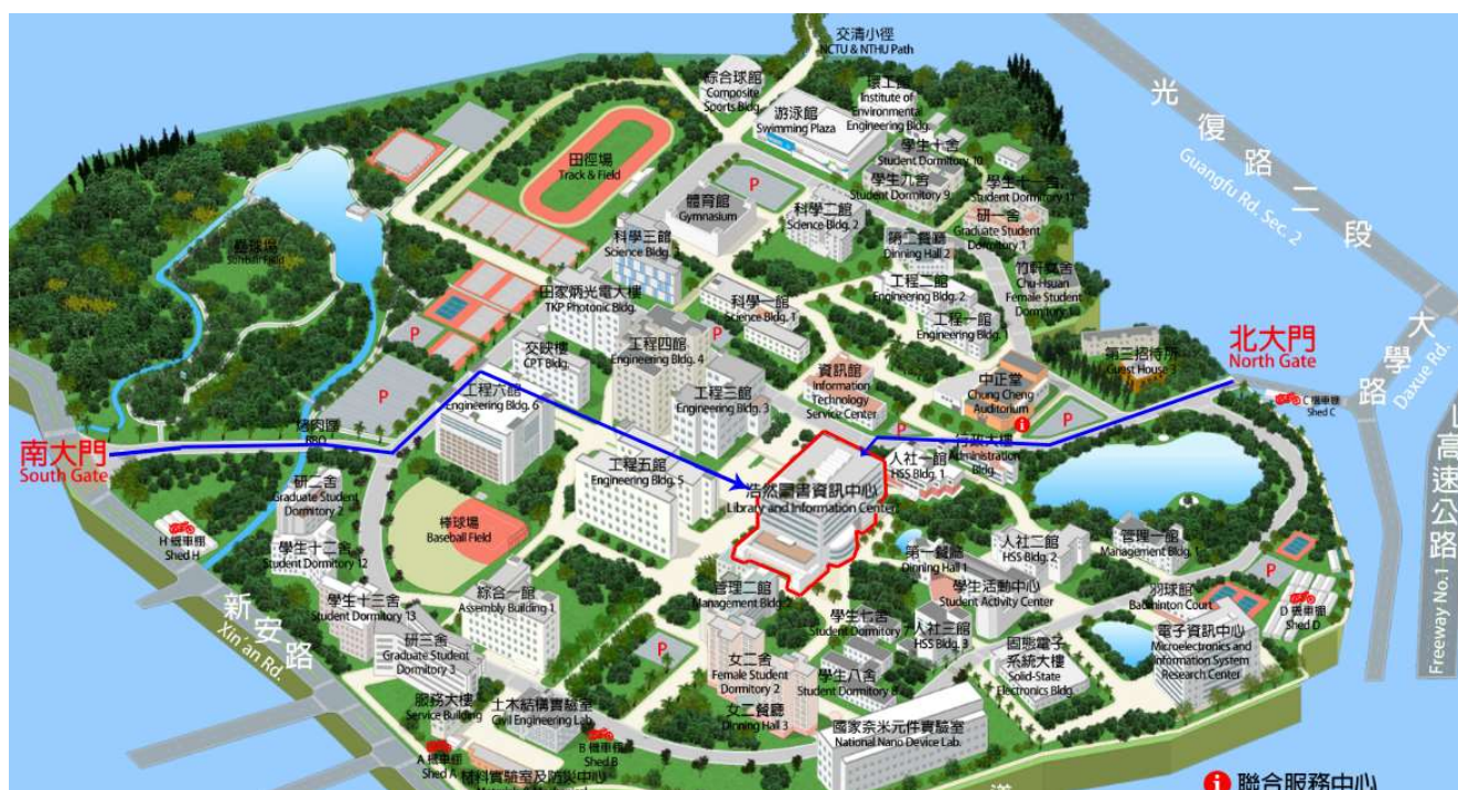
※活動場地位於浩然圖書資訊中心 B1 國際會議廳。